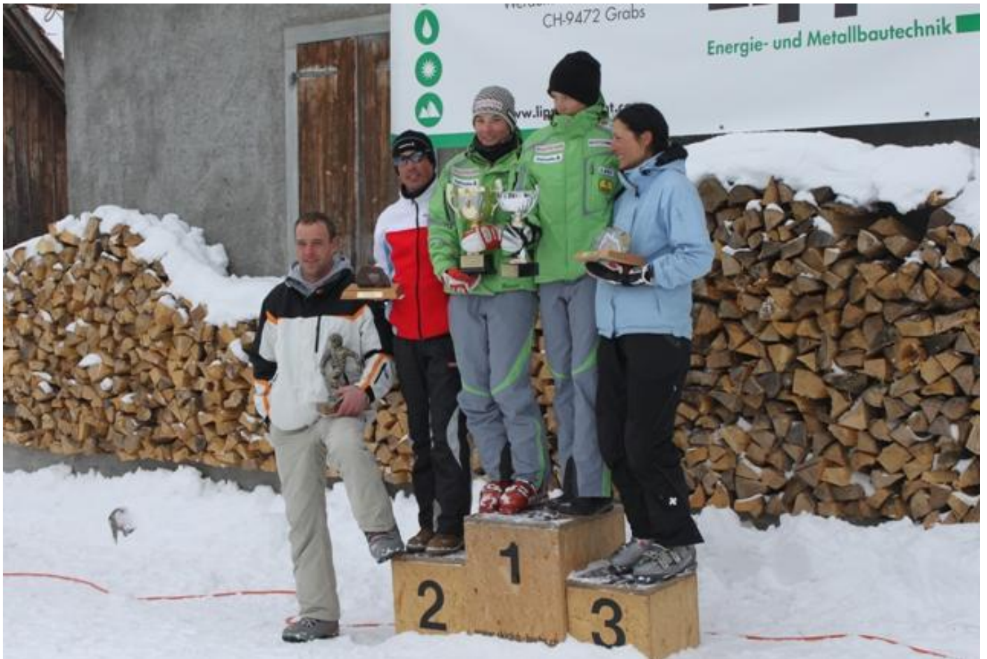
Clubmeister und JO-Clubmeister